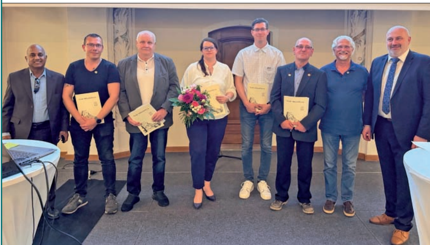
Auszeichnungsveranstaltung der „Ehrenamtlichen des Jahres“ in der Schlosskirche

Die Stadt bedankt sich herzlich bei allen Ehrenamtlichen für ihren unermüdlichen Einsatz. Ehrenamtliches Engagement ist ein unverzichtbarer Bestandteil des gesellschaftlichen Lebens und trägt maßgeblich zum Zusammenhalt in den Ortsteilen bei.