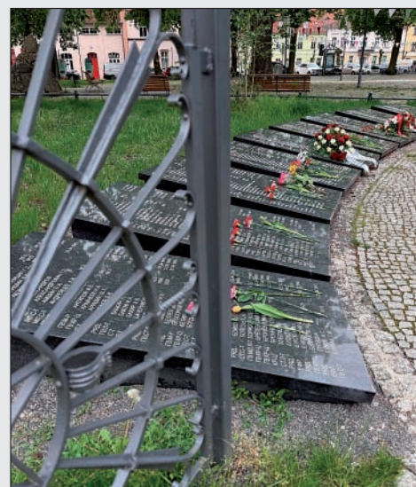
Kriegsgräberstätte auf dem Marktplatz zum Tag der Befreiung

Die Teilnahme von zwei Klassen der Gesamtschule Altlandsberg war besonders eindrucksvoll. Mit den jungen Menschen entstanden offene, interessante Gespräche über Geschichte, Erinnerungskultur, Verantwortung, Frieden und die Rolle junger Menschen in unserer Gesellschaft.