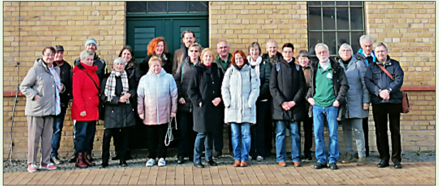
Die Mitglieder des Freundeskreises der Stadtkirche Altlandsberg

Ehrenamtliche telefonisch Kontakt zu der älteren Bevölkerung in Altlandsberg und gingen auch mal einkaufen.