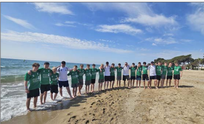
Die C-Jugend des MTV Altlandsberg im Barcelona-Camp

Beim MTV 1860 Altlandsberg ist weit mehr als nur gewöhnlicher Trainingsbetrieb angesagt. Dass der Verein seinen Nachwuchstalenten außergewöhnliche Erlebnisse bietet, zeigten kürzlich die Reisen der C- und D-Jugend.