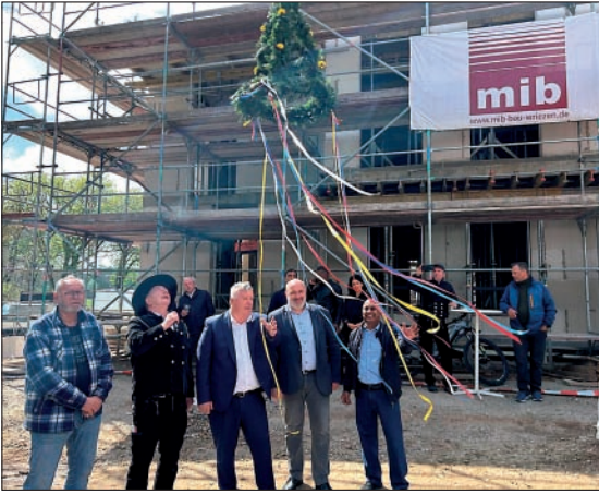
Richtfest des neuen Ärztehauses in Altlandsberg

(jk) Am 24. April 2026 wurde in Altlandsberg ein besonderer Meilenstein gefeiert: das Richtfest für das neue Ärztehaus. Direkt in Nachbarschaft zum Rathaus entsteht ein moderner Ort, der medizinische Versorgung, Pflege, Fürsorge und altersgerechtes Wohnen miteinander verbindet.