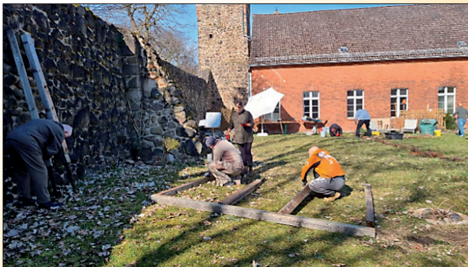
Frühjahrsputz im Heimatverein

Ausgangspunkte am 28.04.2026 im Ortsteil Altlandsberg waren am Heimatverein, auf dem Marktplatz, an der Erlengrundhalle und am Oberschulcampus. Überall dort sah man fleißige Altlandsbergerinnen und Altlandsberger bepackt mit Arbeitshandschuhen und Müllsäcken sternförmig die Umgebung nach Verschandelungen abzusuchen. Nach ca. 3 Stunden getaner Arbeit und vielen vollen Säcken gab es dann beim Heimatverein und bei den „Freunden des Markt-